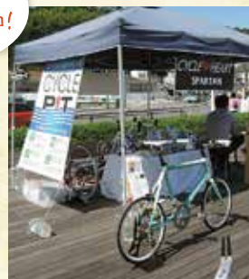
R357 Station (休憩所、サイクルステーション)