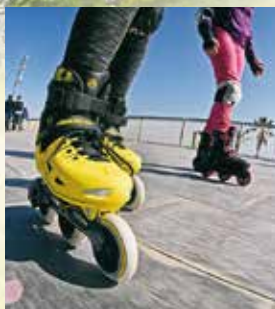
ストリートスポーツキャンプ in R357 (バギー、インラインスケート、スケートボードなど)