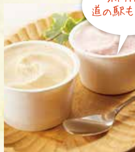
道の駅 出張マルシェ (アイスクリーム、ご当地グルメ)